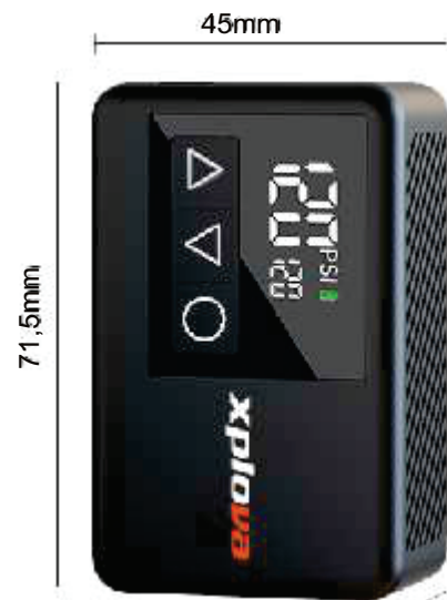
mini pompa elettrica portatile ricaricabile