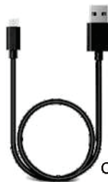
Cavo del caricabatterie